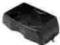
Bac de rangement